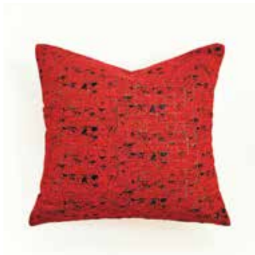
クッション「New York」 税抜価格 33,000円 (税込価格 35,640円)

『HOSOO FLAGSHIP STORE』では、そのテキスタイルを贅沢に用い、ファニチャーやクッション、ルームシューズなどのホームコレクションを展開いたします。卓越した職人技によってのみ成し得る、究極のクラフツマンシップをご自宅でお楽しみいただけます。