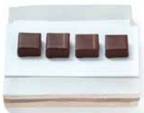
「オリジナルショコラ」 プレーン、プラリネ、柚子、ごま(左より) 各380円(税込価格410円)