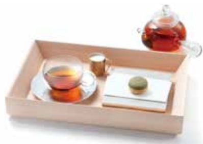
「ペアリングセットミルクティ・マカロン」 1,300円(税込価格1,404円)