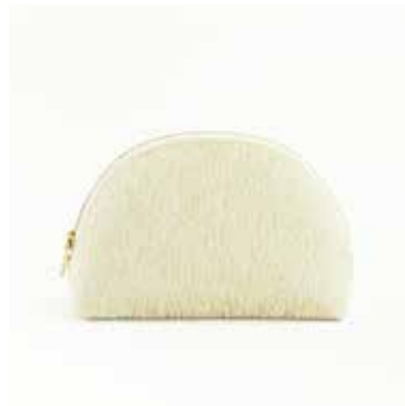
ポーチ ハーフムーン「Bubbles」 税抜価格 21,000円 (税込価格 22,680円)