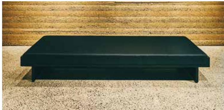
デイベッド「Luster」 税抜価格 460,000円 (税込価格 496,800円)