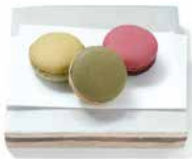
「かさね色目のマカロン」 初紅葉、青紅葉、紅葉(左より) 各400円(税込価格432円)

伝統的な左官技術による土壁や版築を壁面全体に用い、職人によって本金箔を直線に施すなど、職人の手技を感じる「工芸建築」として建てられた『HOSOO FLAGSHIP STORE』。京都の各地で受け継がれてきた技術が集まり、ここからまた次世代へ繋がっていくようなタイムレスなものづくり。クラフトマンシップへの想いを込めた店舗をイメージした、オリジナルのショコラです。