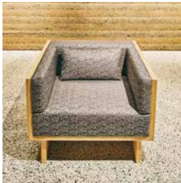
ラウンジチェア「Blink」 税抜価格 590,000円 (税込価格 637,200円)