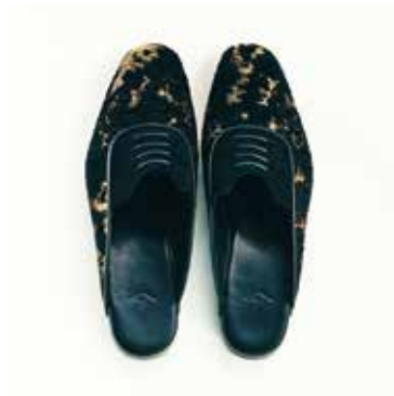
ルームシューズ「Frosted Petals」 税抜価格 70,000円 (税込価格 75,600円)